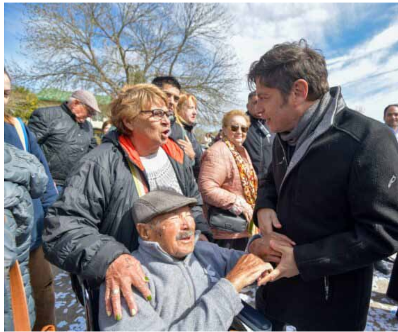
El gobernador Axel Kicillof, junto a un grupo de jubilados bonaerenses

A lo largo del video, que Milei compartió en su cuenta de Instagram, aparecen los principales referentes del kirchnerismo vinculados a una estética apocalíptica, entre ruinas y zombies, realizada con Inteligencia Artificial,