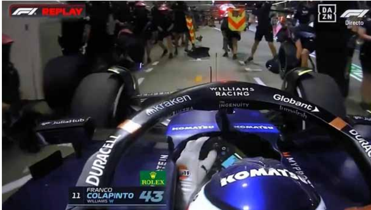
El argentino Franco Colapinto participa de su tercera carrera de Fórmula 1

El piloto argentino protagonizó una divertida perla en el marco de las pruebas de este viernes