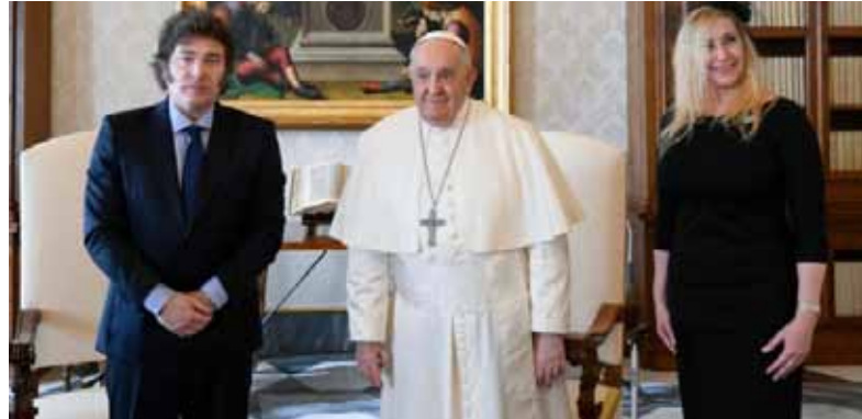
El Papa Francisco junto al presidente Javier Milei y la secretaria General de la presidencia, Karina Milei, en una visita anterior

"Me hicieron ver un filmado de una represión de hace una semana, menos quizás. Obreros, gente que pedía por sus derechos en la calle y la Policía la rechazaba con una cosa que es lo más caro que hay, ese gas pimienta de primera calidad. No tenían derecho a reclamar lo suyo porque eran revoltosos, comunistas... y el Gobierno se puso firme: en vez de pagar justicia social, pagó el gas pimienta. Les convenía. Ténganlo en cuenta", aseguró Francisco.