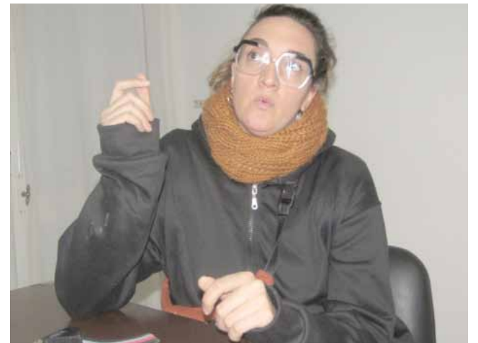
10 mil pesos.