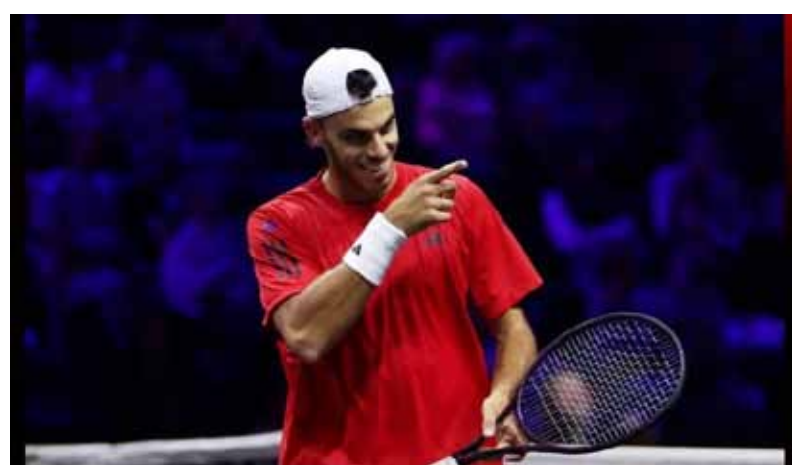
Victoria para Cerúndolo ante Ruud

Stéfanos Tsitsipás venció 6-1 y 6-4 a Thanasis Kokkinakis. El griego no tuvo problemas con el