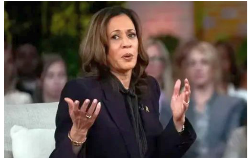
Postura. Harris defendió la tenencia de armas

La vicepresidenta de Estados Unidos y candidata demócrata Kamala Harris, dejó una contundente reflexión sobre la tenencia de armas durante una entrevista con la reconocida conductora Oprah Winfrey.