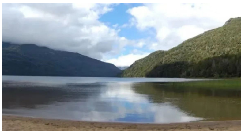
Investigación. El mochilero fue encontrado cerca del lago Falkner

Un marplatense que se encontraba de mochilero en el sur fue hallado muerto en la zona de la Ruta de los Siete Lagos, cerca de la ciudad neuquina de San Martín de los Andes, y la Justicia investiga las causas del deceso.