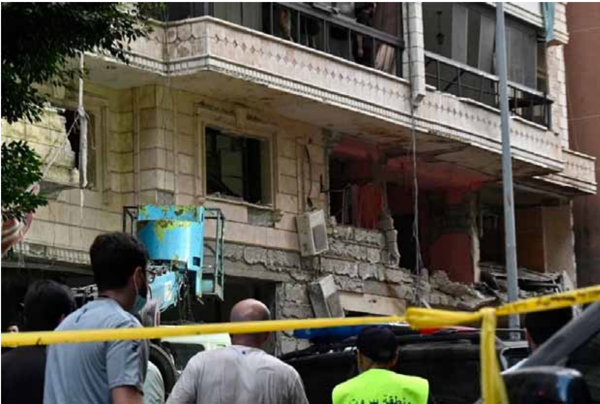
En Beirut. Varias personas se reúnen frente a un edificio dañado

En el ataque aéreo fue abatido Ibrahim Akil, según Israel